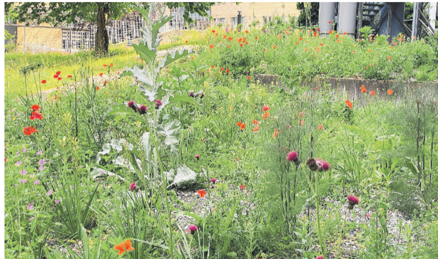
Wildbienenparadies auf über 2300 m² rund um das Gebäude der ZKB/Post.

Im Rahmen von «Biodiversität leben» ist die Bevölkerung eingeladen, das Wildbienenparadies rund um das Gebäude der ZKB/Post zu erkunden. Pflanzen und Tiere haben sich in enger Wechselwirkung miteinander entwickelt. Der Evolutionsprozess hat Millionen von Jahren gedauert. Viele Einflussfaktoren spielten dabei eine Rolle. So hat sich in den verschiedenen Regionen der Welt eine ganz spezifische Pflanzen- und Tierwelt entwickelt. Viele der hochkomplexen Wechselwirkungen und Entstehungsprozesse sind uns Menschen bis heute ein Rätsel. Was wir wissen, ist, dass immer mehr Arten, Tiere und Pflanzen aussterben. Vergleichen wir unsere Erde mit einem Turm gebaut aus Steinen, dann wissen wir nicht, wann welcher fehlende Stein unsere Erde aus dem Gleichgewicht bringen wird.