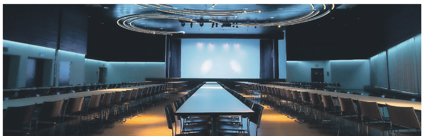
Ihre Stimme zählt – verhelfen Sie dem Konferenzzentrum Schluefweg zu einem Swiss Location Award.

Von 1. bis 31. Mai kann via www.eventlokale.ch eine Bewertung abgegeben werden. Mitmachen können alle, die das Konferenzzentrum auch als Gast kennen, und natürlich Veranstalter/-innen und Eventprofis. Jede Bewertung verhilft zu einer der begehrten Award-Auszeichnungen.