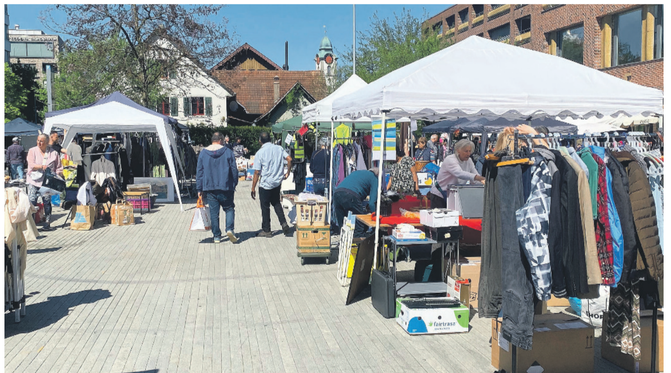
Von Schmuck bis Geschirr: Klotener Flohmarkt lockte mit Vielfalt und Sonnenschein.