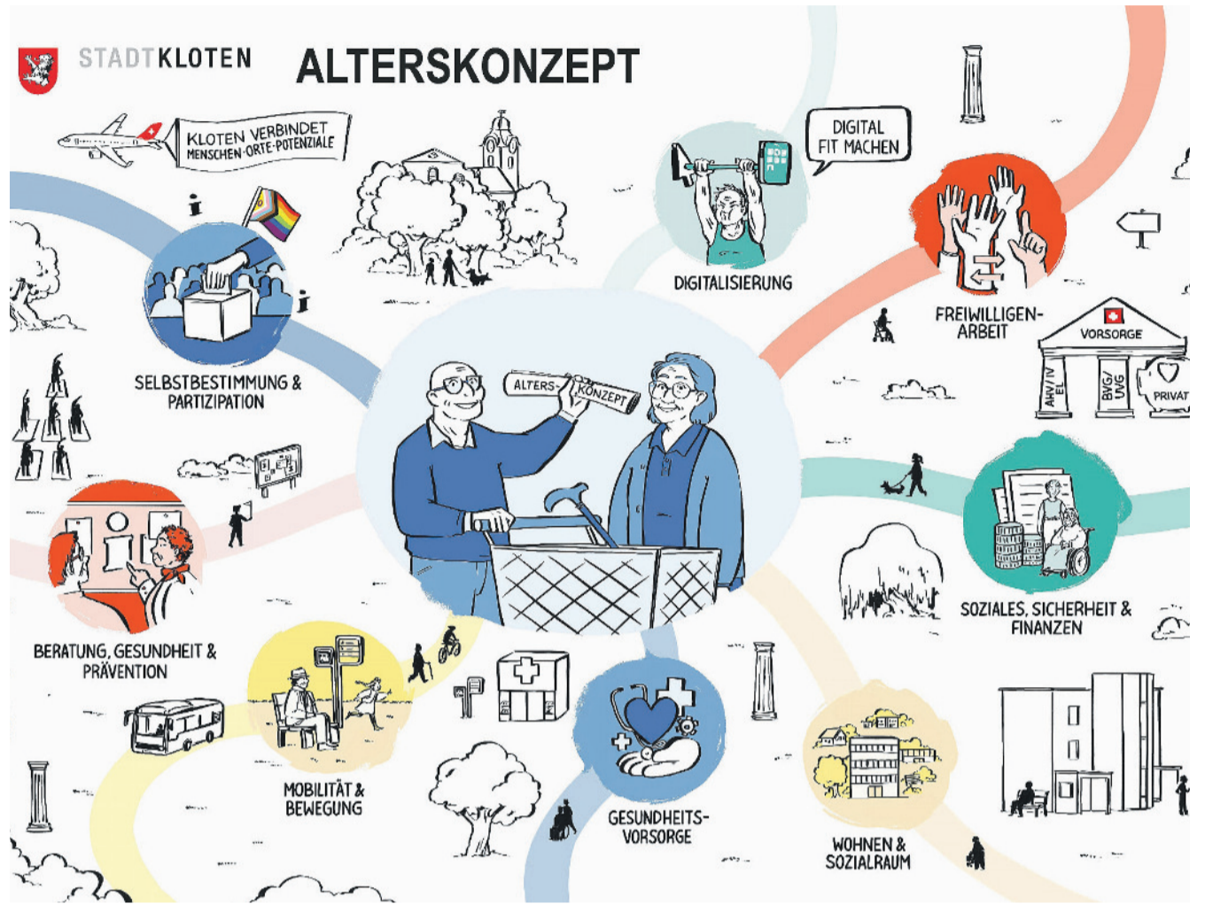
Das Alterskonzept ist ein Abbild der aktuellen und der künftigen Versorgung der älteren Bevölkerung in Kloten.